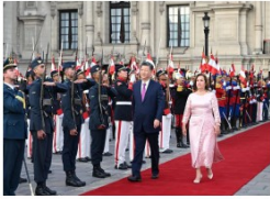
习近平同秘鲁总统博鲁阿尔特举行会谈