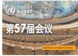
联合国人权理事会第五十七届会议