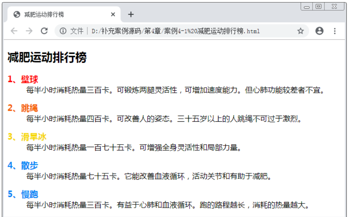
图4-2 减肥运动排行榜效果展示