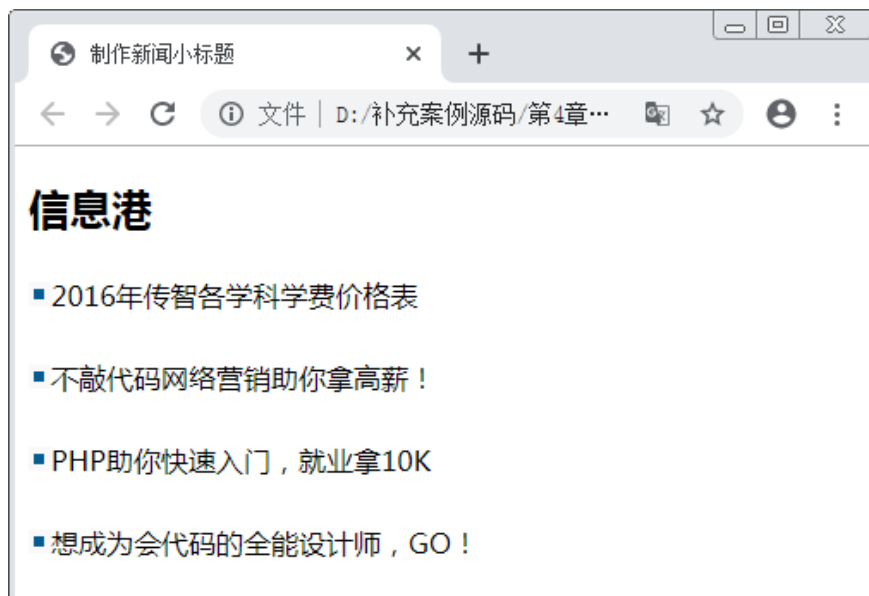
图4-10 新闻小标题效果展示