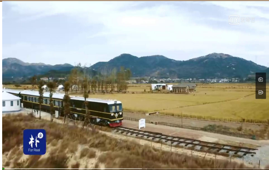
视频：黄梅袁夫稻田 践行绿水青山就是金山银山