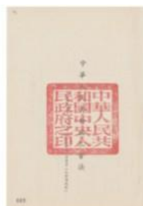
持有国印的珍贵文物

1949年10月1日，中华人民共和国中央人民政府在北京成立。在中国共产党历史展览馆，陈列着新中国第一枚“国印”——中华人民共和国中央人民政府印章。它曾经是国家主席或中央人民政府颁发各种法令、命令、指示和行