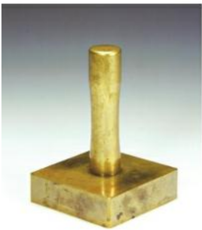
中华人民共和国中央人民政府印章