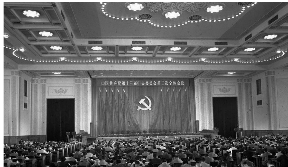
1988年9月26日至30日，党的十三届三中全会在北京召开

1988年9月，党中央召开了 十三届三中全会 。全会同意中央政治局对我国政治经济形势的分析，批准中央政治局提出的治理经济环境、整顿经济秩序、全面深化改革的指导方针和政策、措施。《在中国共产党第十三届中央委员会第三次全体会议上的报告》提出了 治理经济环境、整顿经济秩序 的具体要求和措施。