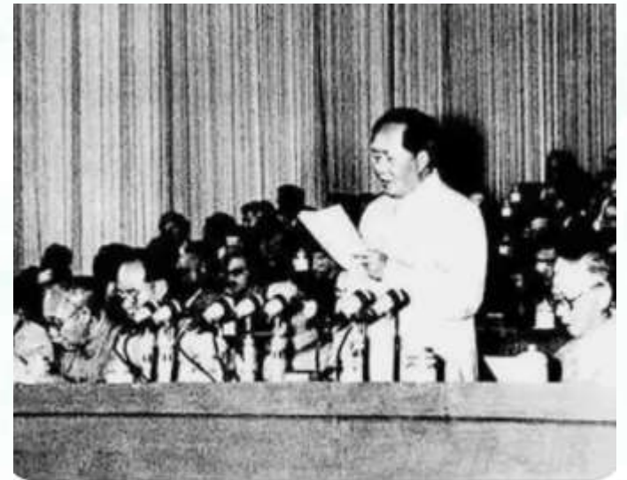
党的八大坚持党中央提出的既反保...